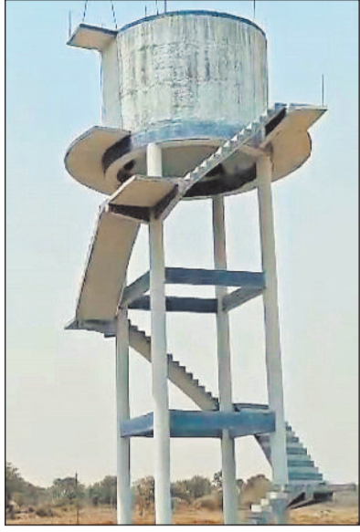
मोहदी गांव में निर्मित पानी टंकी।

सारंगढ़। बिलासपुर तहसील के ग्राम बेलटिकरी एवं छपोरा क्षेत्र में राजस्व विभाग एवं खनिज अमला द्वारा संयुक्त निरीक्षण किया गया। निरीक्षण के दौरान ग्राम छपोरा में गौण खनिज पत्थर के अवैध उत्खनन में संलिप्त पोकलेन मशीन पर नियमानुसार जापित एवं सुपुर्दी की कार्यवाही की गई। इस कार्यवाही में छत्तीसगढ़ गौण खनिज नियम 2015 एवं खान एवं खनिज विकास अधिनियम 1957 की धारा 21 के तहत की गई। अवैध रेलेखन परिवहन एवं भण्डारण की कार्रवाई की गई है।