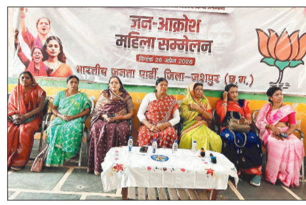
महिलाओं की भागीदारी से कांग्रेस मरनीत

नारी शक्ति वंदन अधिनियम का लोकसभा में विरोध किए जाने तथा विधेयक को पारित होने से रोकने के विपक्षी प्रयासों के खिलाफ प्रदेश नेतृत्व के निर्देशानुसार भाजपा महिला मोर्चा द्वारा जिला भाजपा कार्यालय में महिला आक्रोश सम्मेलन आयोजित किया गया। सम्मेलन के उपरांत महिला मोर्चा की कार्यकर्ताओं ने आक्रोश रैली निकालते हुए बस स्टैंड पहुंचकर पुतला दहन किया और कांग्रेस के विरोध में जमकर नारेबाजी की।