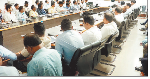
जिसे अंतिम तिथि 30 अप्रैल 2026 निर्धारित की गई है।

विस्तार से समीक्षा की उन्हीने अधिकारियों को बताया कि भारत की जनगणना 2027 के अंतर्गत चल रही स्व-गणना प्रक्रिया 16 अप्रैल से जिले में जारी है।