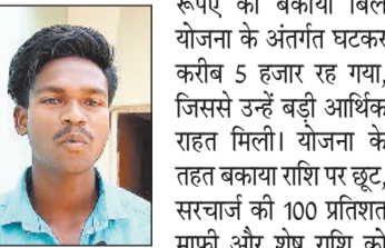
आसान किस्तों में जमा करने की सुविधा मिलती है।